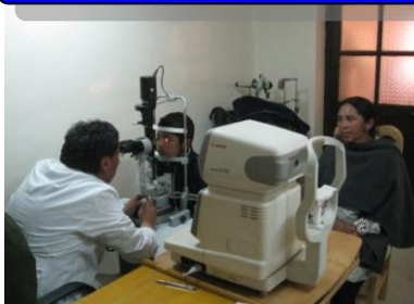
Revisión Infantil en Potosí.

La educación es el futuro. Por eso hemos comenzado en todos nuestros proyectos, campañas escolares para dar gafas nuevas a los niños por unos 10 €.