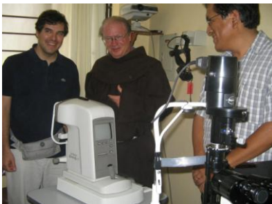
Barrio Nuevo Progreso. Lima